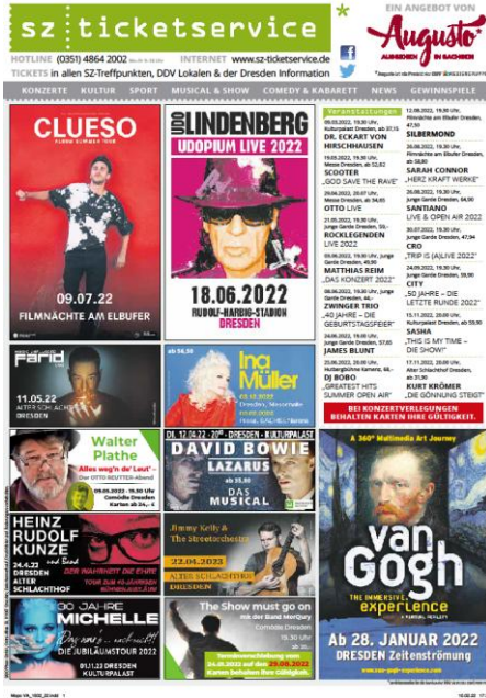
Beispiel für unsere Ticketseite in der Zeitung

Jeden Dienstag und Freitag (kann variieren) erscheint unsere Ticketseite in der Gesamtausgabe der Sächsischen Zeitung und immer dienstags in der Dresdner Morgenpost.